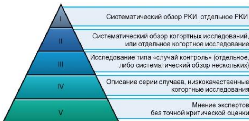
Рисунок 1. Уровни доказательности

Шкала уровней доказательности, разработанная Оксфордским Центром доказательной медицины (Oxford Centre for Evidence-Based Medicine).